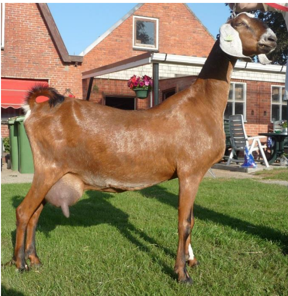
Clementine v Oudwoude (CVE 189)

Op de laatste pagina van deze nieuwsbrief vindt u de in 2013 afgesloten melklijsten. De lijst wordt aangevoerd door Clementine van Oudwoude.