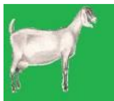
Fokgroep Nubische geiten

Notulen van de algemene ledenvergadering van de Fokgroep Nubisch gehouden op 28 januari 2011 te Harderwijk.