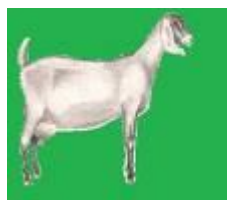
Fokgroep Nubische geiten

Notulen van de algemene ledenvergadering van de Fokgroep Nubisch gehouden op 28 januari 2011 te Harderwijk.